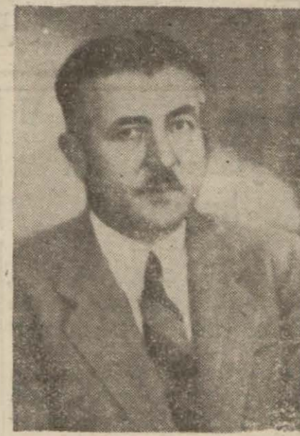
Ticaret Vekili Mümtaz Ölmien

Ana maddelerin fiatlarını bir birleriyle mütenasib ve uygun seviyede tutmak ve mevsim sonuna kadar bir daha bunları değiştirmek yolundaki mühim iktisadi hareket şimdiye kadar hükümetin diğer mütemmim bir tedbir de hükümetçe satın alınacak veya el konulacak maddelerin tedarikinde bu işlerle alakalı tacirlerin de alakasına ve tavassutunu-