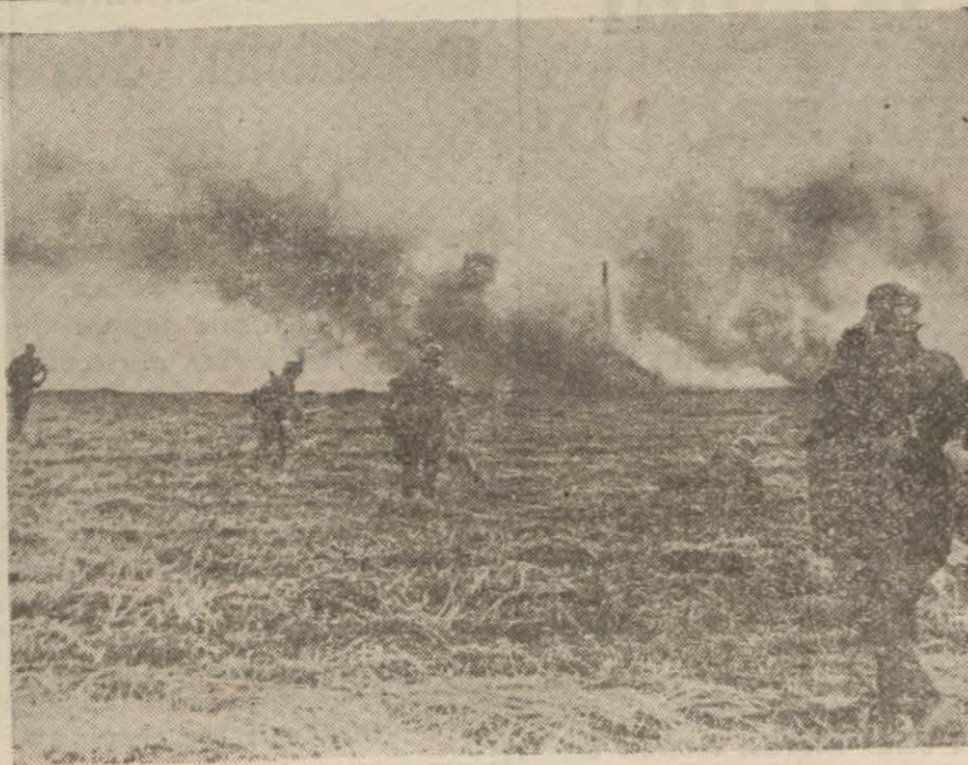
Şark cephesinde bir muharebe sahnesi

Londra 28 (A.A.) — Kral Victor Emanuel ile İtalya veliahdinin şimal batı İtalyada toplanan kuvvetleri teftiş ettiklerine aid olarak Romadan verilen haberin üzerinden daha 24 saat geçmeden, Londradan, Mareşal Petainin yarın Chateau-Roux'da toplanan Fran-